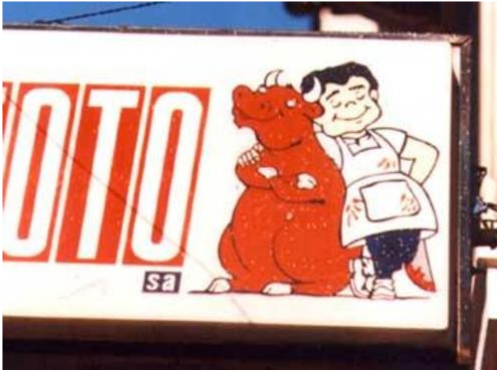
Imagen publicitaria de la cadena de carnicerías Coto S.A. en tiempos de dictadura.