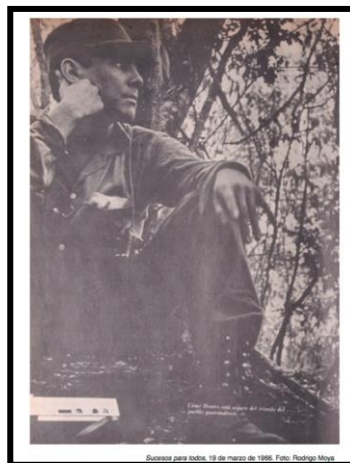
Imagen 3 Fotografía publicada en la revista Sucesos , (sin Rosa María) Hemeroteca Nacional.

No obstante, para Rodrigo Moya la imagen fue publicada de esa manera en Sucesos porque fue una decisión de la dirección de la revista, de la cual se enteró hasta ver publicada la foto.