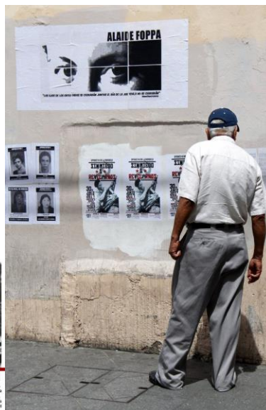
Imagen9 A la izquierda el afiche realizado por HIJOS 2017, de lado derecho, un hombre se detiene en la calle a observar el afiche.