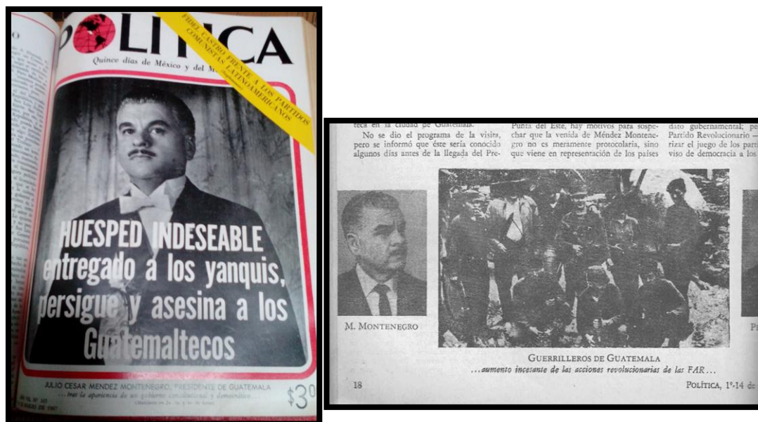
Imagen 6

archivo CEMOS (Centro de Estudios del Movimiento Obrero y Socialista) ahora también sabemos que se publicó en la revista del Partido Comunista: Política en el N° 165 del 1° - 14 marzo de 1967. Precisamente un año después de la primera publicación de la fotografía en Sucesos en el marco de la visita de Menéndez Montenegro a México, cuya visita generó protestas y denuncias públicas por parte de los militantes mexicanos, tanto que hasta en la portada de Política se publicó la foto de Montenegro acompañada de un texto que decía “Huésped indeseable entregado a los yanquis, persigue y asesina a los guatemaltecos. (ver imagen 6)