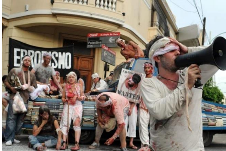
Fotografía del Grupo Etcétera