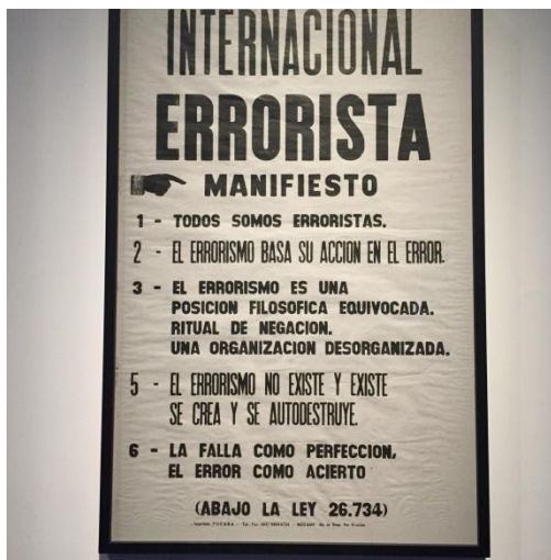
Fotografía de María de la Victoria Pardo – Centro Cultural Néstor Kirchner – Muestra “Democracia en obra”