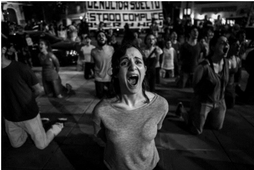
Fotografía de Mu-La vaca

Ellas y ellos se sacan las bolsas, se liberan, se paran, miran al domicilio y se van.