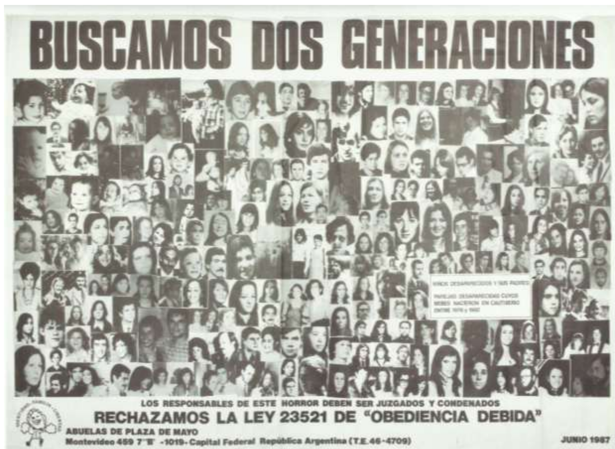
Afiche: Buscamos dos generaciones (1987)