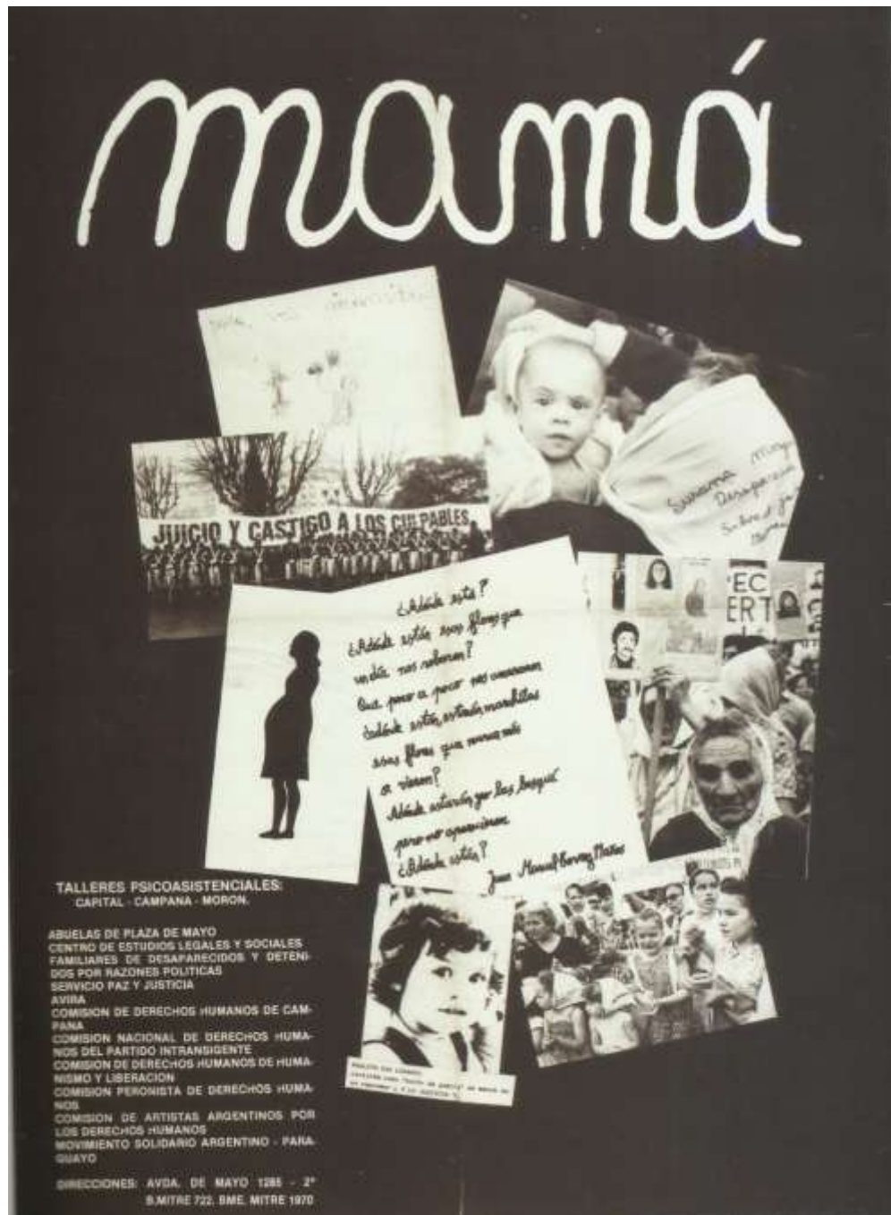
Afiche: Mamá, niños desaparecidos (1977-1978)