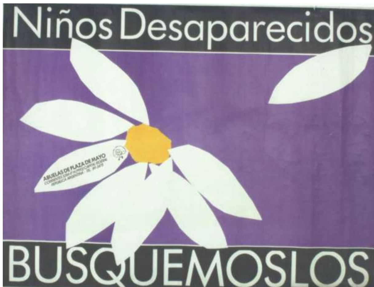
Afiche: Niños desaparecidos (año desconocido, posterior a 1983)