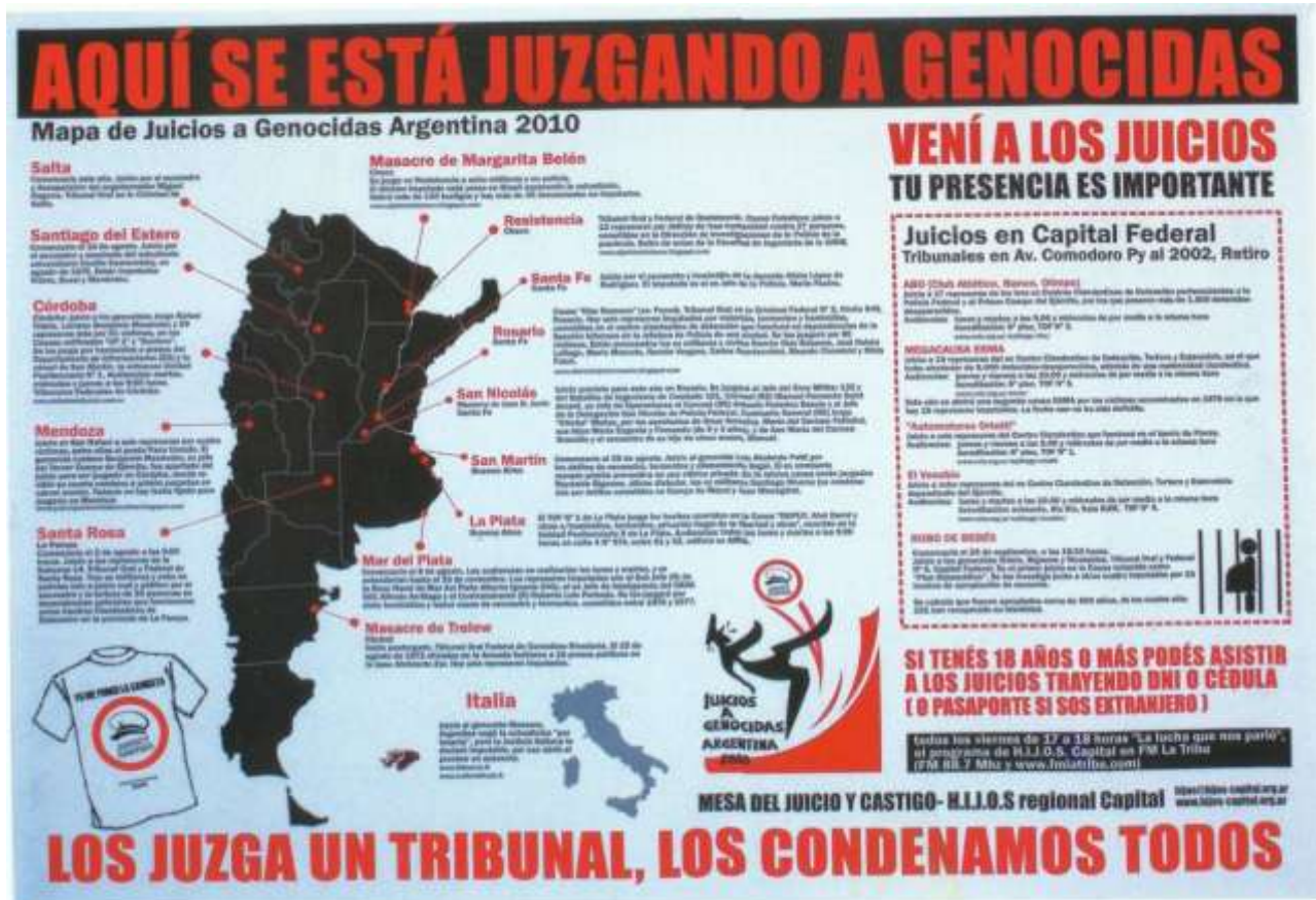
Afiche: Aquí se está juzgando a genocidas (2010)