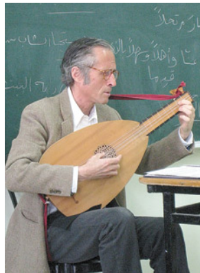
Smith es una referencia indiscutida de su instrumento, el laúd.

Nacido en Nueva York y graduado en la Universidad de Harvard con honores, Hopkinson Smith se trasladó a Europa en 1973, para estudiar con Emilio Pujol y Eugen Dombois, entre otros. A mediados de 1970 participó en la fundación del primer Hespèrion XX, y desde mediados de los '80 se especializó en la música solista para los antiguos instrumentos de cuerda pulsada (vihuela, el laúd renacentista y barroco, la tiorba y las guitarras renacentistas y barrocas). Entre sus producciones discográficas más importantes se encuentra la transcripción que él realizó para laúd de las Sonatas y partitas para violín solo de Johann Sebastian Bach, siguiendo el modelo del propio Bach y partiendo de la hipótesis de que, probablemente, algunas de sus Suites para laúd fueron arreglos hechos por el propio compositor de obras escritas originalmente para otros instrumentos. La revista especializada Gramophone calificó a estas versiones como "posiblemente las mejores que existen de estas obras, en cualquier instrumento". En el concierto de este domingo, Smith abordará algunas de las obras más refinadas y perfectas (además de melancólicas) de la historia