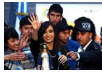
Relato del Presente Villa Argentina