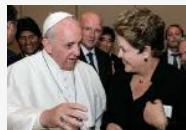
Dilma invitará al papa Francisco al Mundial