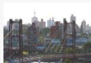
Fuerte explosión en Santa Fe