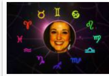
Astrocoach El que avisa no es traidor