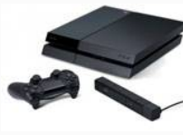
Conexión Continua Llega la Playstation 4