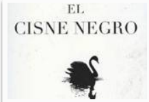
Página 99 Nassim Nicholas Taleb: El Cisne Negro