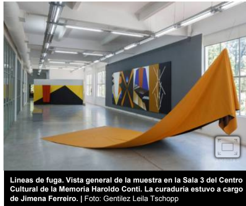
Lineas de fuga. Vista general de la muestra en la Sala 3 del Centro Cultural de la Memoria Haroldo Conti. La curaduría estuvo a cargo de Jimena Ferreiro.