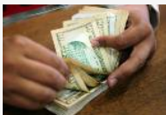
Estiman que el dólar oficial superará los $10 en julio