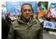
Luis D'Elia pidió que Maduro fusile a Leopoldo López