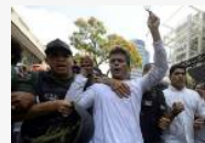
Se entregó el líder opositor venezolano prófugo de la Justicia