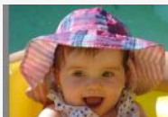
Los chicos nos miran