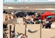
Otra vez el cuatriciclo: está grave una nena de 11 años