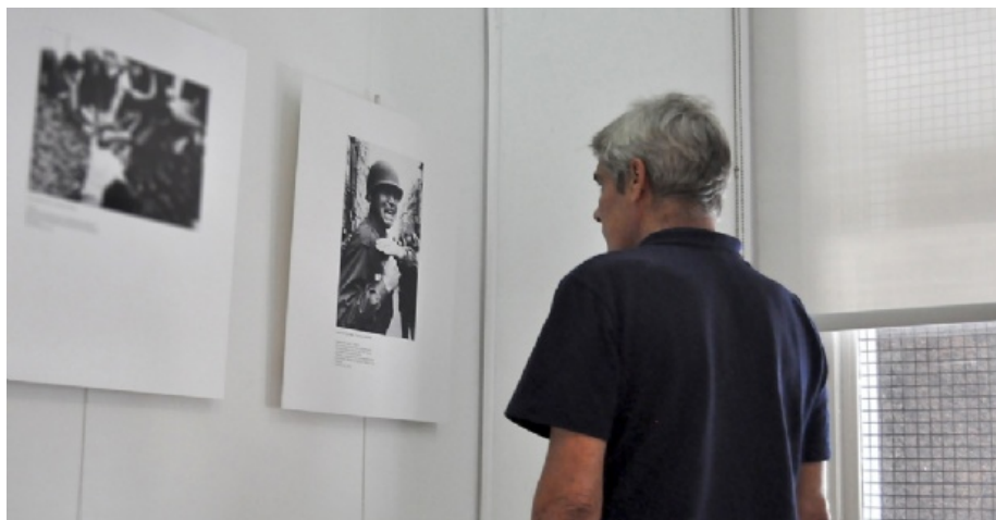
Muestra itinerante "Recorridos por la Memoria 1955-1990" se expone en la Escuela de Arqueología de la UNCA.

(0) (0) Enviar Imprimir viernes, 29 de junio de 2018